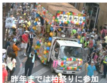
昨年までは柏祭りに参加

例年、柏まつりで日頃の練習の成果を披露してきた子供会の「柏元気太鼓」。今夏から花自動車がパレードに乗入れすることが禁止されたため、演技の場がなくなりました。子供会では伝統を絶やさず今後も練習を続け、発表の場を模索していくことにしています。「柏元気太鼓」は平成 17 年、当時の本多市長によって命名されました。4 年生から参加し、6 年生で柏まつりのパレードで演技するのが目標でした。パレードの廃止は子供たちにはショック。子供会では、南柏まつりへの出演を交渉し、7 月 24 日のまつりで披露することができました。今後も町会の夏祭り、餅つき大会などの行事の際に発表することに。子供会では「卒業したらサヨナラではなく、中高生になっても一緒に練習や発表の場ができればいいのですが」といい、町会も「OBやOGも含めた地域のサークルに育てていければ…」とバックアップに力を入れていく方針です。