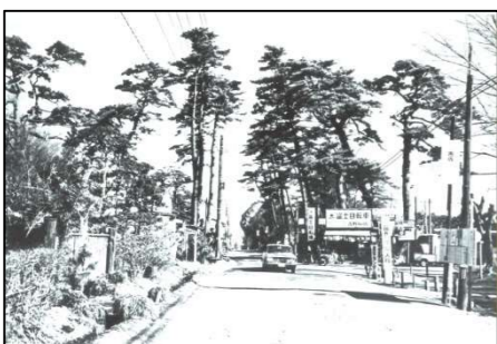
昭和 30 年代の南柏駅入り口付近

豊町東町会が創立 20 周年を迎えるのを記念して、町会の歩みと、合わせて地域の歴史を 1 冊にまとめる事業を企画しました。豊町町