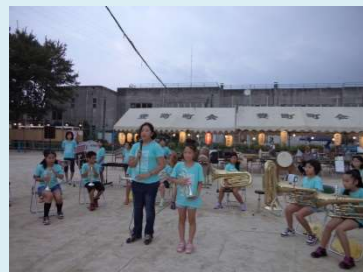
豊小学校からはおなじみの「金管クラブ」の演奏(20日)