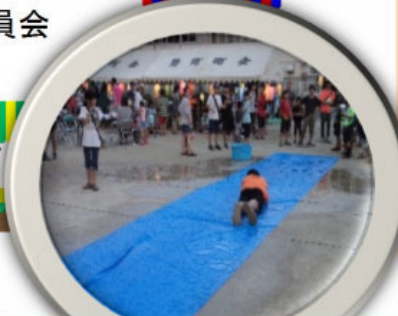
昨年、2日目は雨。なんと！急拵えのウォータースライダーが登場！！