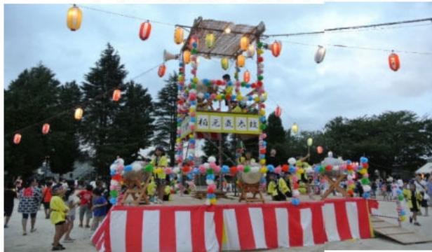
※場内の配置は変更になる場合があります。